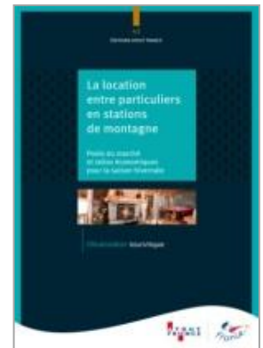
La location entre particuliers en stations de montagne Poids du marché et ratios économiques pour la saison hivernale Atout France – Juin 2015

L'enjeu aujourd'hui pour les destinations de montagne est d'améliorer les performances de remplissage des lits existants. La location entre particuliers, propose des taux d'occupation encore inférieurs à ceux des hébergements collectifs marchands ou des biens commercialisés en agences immobilières mais qui se situent d'ores et déjà à presque 7 semaines. Ceci constitue donc une réelle opportunité qui doit désormais être pris en compte dans les stratégies marketing des stations.