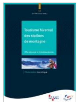
Tourisme hivernal des stations de montagne Offre, demande et évolutions récentes Atout France – Octobre 2015

Le nouveau calendrier scolaire doit servir de catalyseur et constituer une opportunité d'amplifier la diversification des pratiques et l'enrichissement des expériences grâce à la mobilisation de tous les acteurs. L'enjeu consiste aujourd'hui à faire les bons choix en agissant collectivement sur les meilleurs leviers.