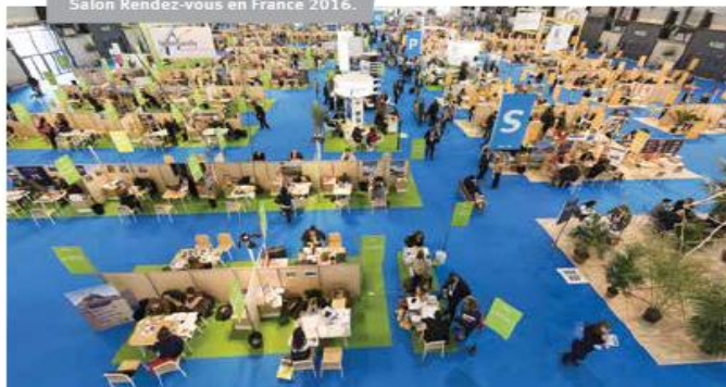
Salon Rendez-vous en France 2016.

Pour en savoir plus : www.atout-france.fr ou www.france.fr