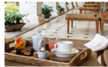
Les meilleures recettes des villes d'eau