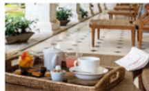
Les meilleures recettes des villes d'eau