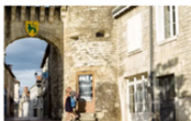
Week-end bien-être dans les villes d'eau