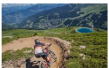
Des séjours à fond la forme dans les villes d'eau