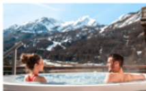
13 stations thermales pour s'oxygéner en montagne