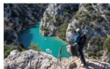
8 escales pour se reconnecter à la nature