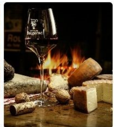
Savour our authentic products

Ainsi, au Royaume-Uni, une campagne a été lancée début janvier en collaboration avec Skyscanner et Dordogne Périgord Tourisme afin d'inviter les Britanniques à venir (re)découvrir le patrimoine et l'art de vivre de la destination au printemps.