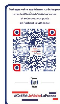
QR code #CetÉtéJeVisiteLaFrance