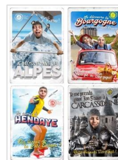
Filtres instagram #CetÉtéJeVisiteLaFrance